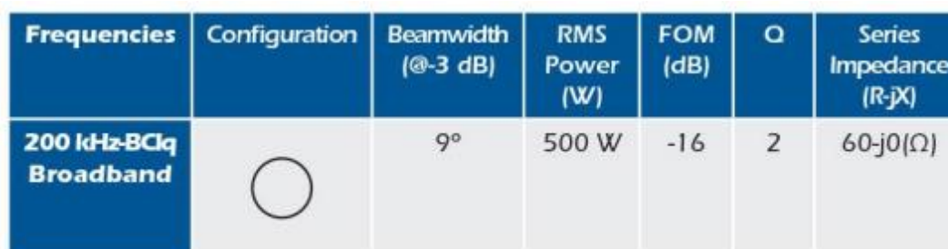
Tabela 4. Especificações da haste.